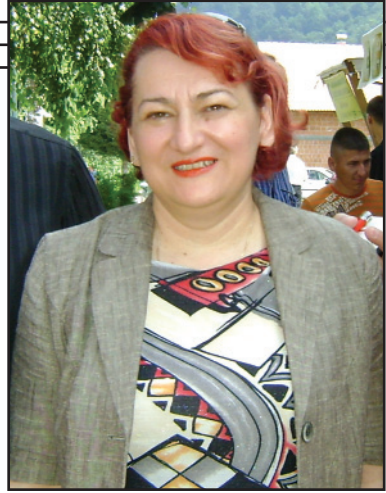
SNJEŽANA RAJILIĆ, načelnica Novog Grada