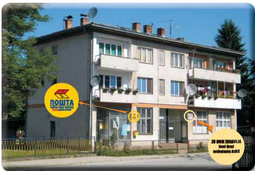
Druga stambena zgrada sa ambulantom, poštom i stanovima za prosvjetne i zdravstvene radnike izgrađen 1972. godine

Što se tiče školstva u kojem sam tada radio, Dragan nam je uvijek bio na raspolaganju ako je trebalo nešto unaprijediti. Gradio je stanove za nastavnike, škole u okolnim selima, zadruga je u to vrijeme bila oslonac za cjelokupan život sela. Treba znati da je tada bilo vrlo malo obrazovanih ljudi koji su mogli pomoći u rešavanju problema kojih je bilo na pretek. Zajedno sa direktorima škola vodio je akcije govoreći kako djecu treba učiti radu od malih nogu, i sjećam se da su učenici starijih razreda radili i na putu i učestvovali u drugim akcijama. Sada, pola vijeka poslije, možemo reći da je Dragan mnogo pomogao i dao veliki doprinos u izgradnji škola koje su tada bile prepune učenika. U političkom radu je bio vrlo aktivan i zanimljivo je da je bio odbornik od rata do smrti-1983. godine. Decenijama je neumorno radio kao društveno-politički radnik bez ikakve materijalne nadoknade, a posebno su velike njegove zasluge na izgradnji moderne osmogodišnje škole u Donjim Agićima, izgradnji trafostanice u Donjim Agićima, zatim pošte sa automatskom centralom, ambulante i stomatološke ambu-