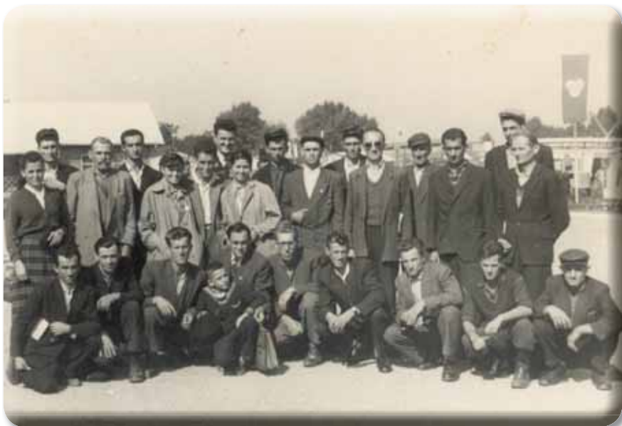
Zadrugari iz Donjih Agića na Novosadskom poljoprivrednom sajmu 1957. godine