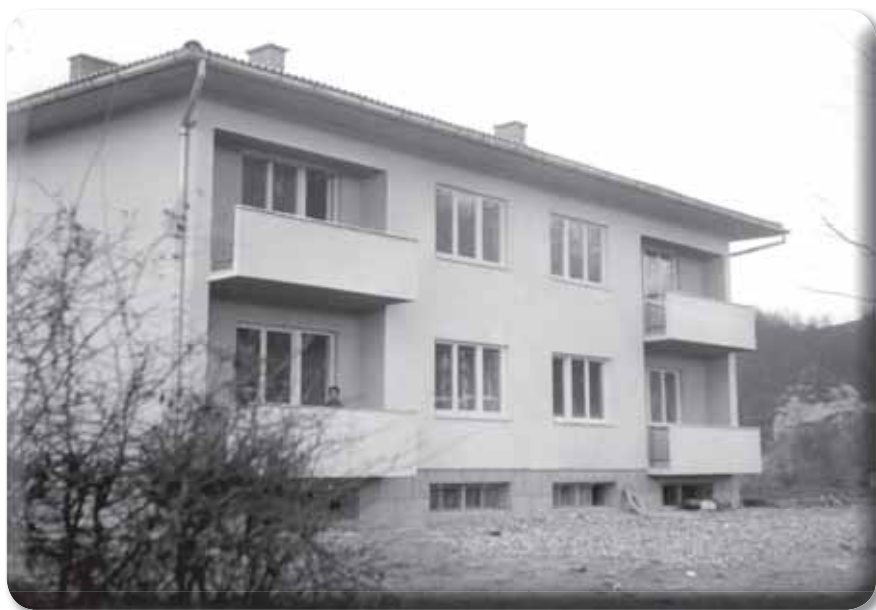
Prva stambena zgrada u Donjim Agićima 1964. godine namijenjen prosvjetnim radnicima