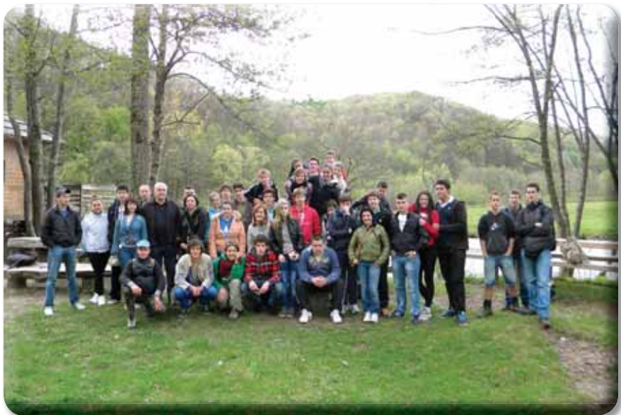
Italijanski studenti zajedno sa đacima Poljoprivredne škole iz Prijedora u Donjim Agićima 2012. godine

Tokom avgusta 2009. godine, zahvaljujući Vladi Republike Srpske, u potpunosti je završeno asfaltiranje puta dolinom Japre od Blagaja, gdje se Japra ulijeva u Sanu, preko Donjih Agića, Budimlić Japre i Dubovika, pa sve do Hašana, rodnog mjesta poznatog književnika Branka Ćopića, i susjednog sela Majkić Japre gdje na Radanovom polju, ispod Grmeča, izvire ova bistra i nestašna planinka Japra. Donji Agići imaju