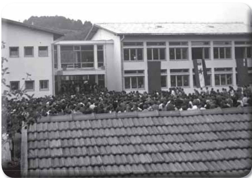
Sa svečanog otvaranja novoizgrađene osnovne škole u Donjim Agićima, 1972. godine.

puta kroz našu dolinu. Izvlačili smo kamen a od opštine smo dobili valjak koji je valjao postavljeni kamen. Nebrojeno akcija je vodio taj vrijedni čovjek i gotovo nikada i niko nije ni pokušao da izbjegne neku od akcija, mnogo se radilo ali niko nije osjećao teret. Posebna priča je most u Blagaju, e to se ne zaboravlja, koliko je samo truda tada uložio naš direktor mislim da je tada već postao legenda. Vodio je akciju, poslije Drugog svjetskog rata, oko izgradnje škole u mom selu Hozićima, puno me sjećanja veže za njega i kažem da se takav čovjek rijetko rađa. Sjetim se da je sirotinja uvijek u njemu