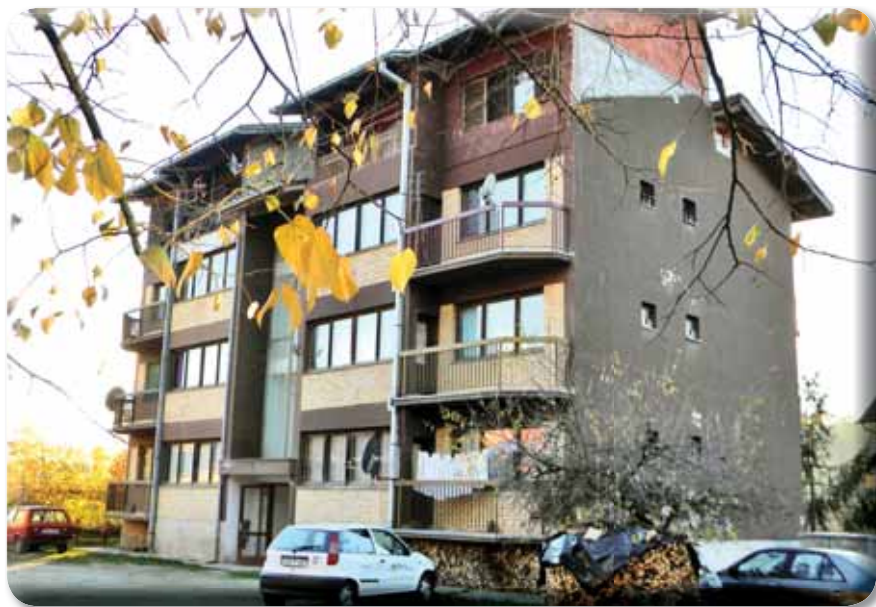
Treća stambena zgrada u Donjim Agićima namijenjena prosvjetnim radnicima i stručnjacima zadruga, izgrađen je 1978. godine.