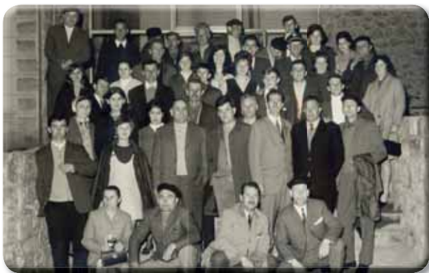
Zajednički snimak zadrugara pred odlazak u Italiju 1970. godine