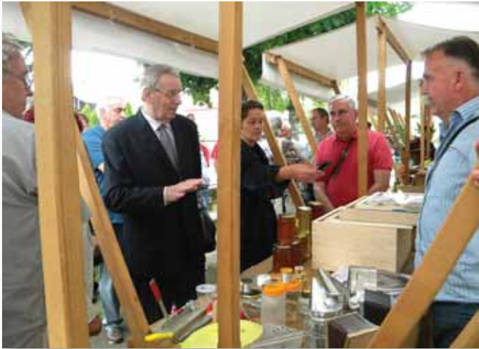
Na štandu Pčelarske zadruge „Matica“ iz Banja Luke