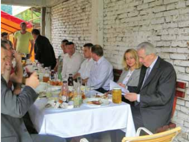
Domaćini i gosti sajma