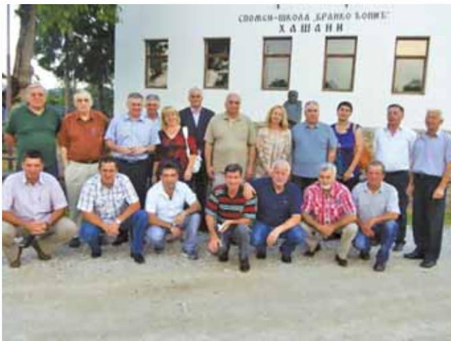
Izlet u Hašane: Učesnici Okruglog stola pred spomen Školom „Branko Čopić“