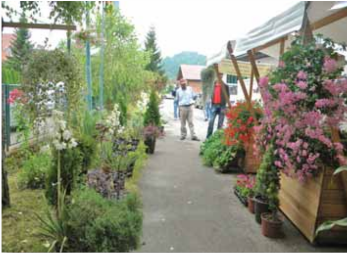
Sadnice cvijeća i ukrasnog drveća iz rasadnika „Čulić“ – Rudice