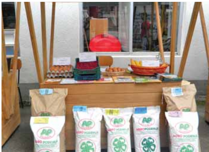
Štand PZ „Agropodrinje“ iz Zvornika