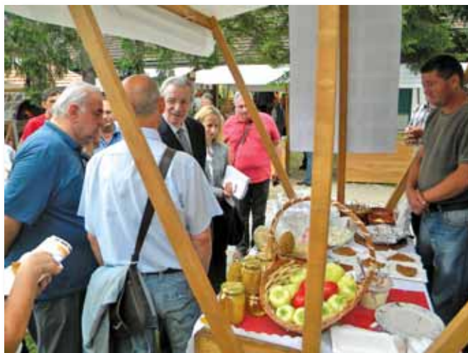
Gosti Sajma na štandu Sloww Food-a