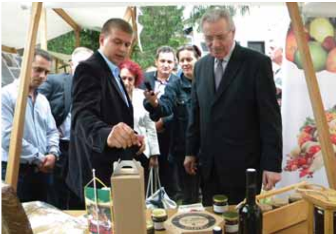
Ministar Stevo Mirjanić na štandu Zadrudnog saveza Republike Srpske razgleda proizvode zadruga: ZZ „Obudovac“ iz Šamca, PZ „Lovac“ Bijeljina, „Žalfija“ Trebinje, PZ „Hana“ Srebrenica, PZ „Srebrenica“ Srebrenica, ZZ „Livač“ Aleksandrovac, ZZ „Podrumi banjalučke biskupije“ Laktaši