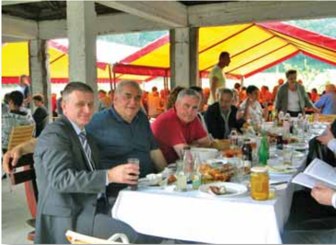
Gosti i domaćini za zajedničkom trpezom