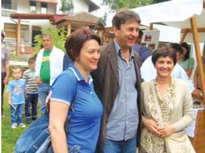
Gosti iz Banja Luke na sajmu u Donjim Agićima