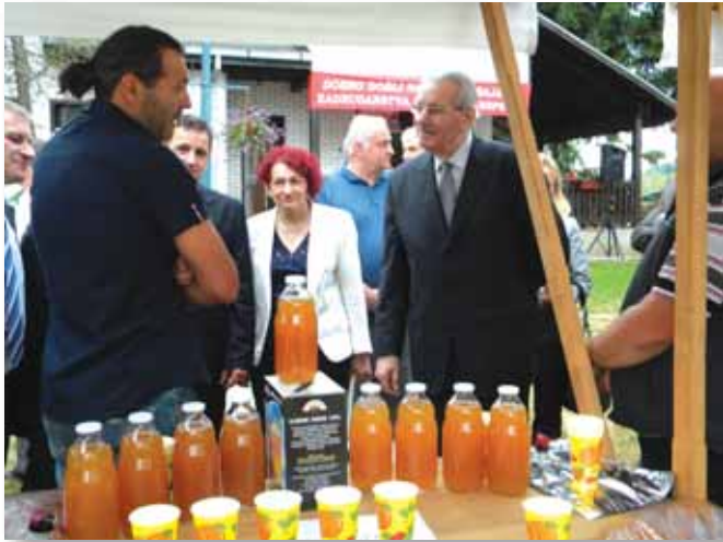
Na štandu PZ „Zlatne kapi Potkozarja“ Gradiška