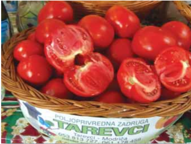
Paradajz iz PZ „Tarevci“