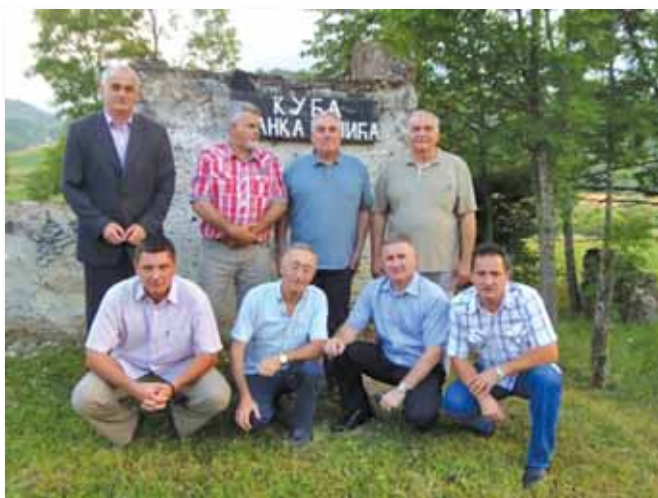
Učesnici Okruglog stola pred ostacima rodne kuće Branka Čopića u Hašanima