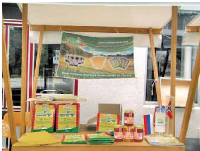
Štand ZZ "Agro Una" iz Donjeg Vodičeva