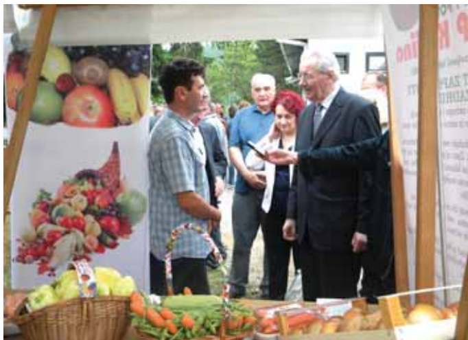
Na štandu Poljoprivredne zadruge „VIP Krajina“ Laktaši