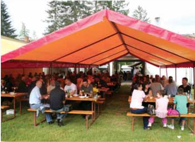
Za zajedničkom zadružnom trpezom