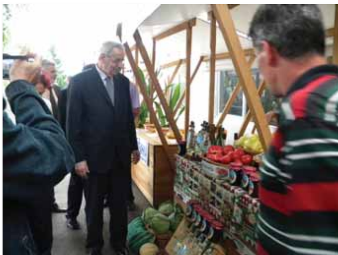
Ministar Stevo Mirjanić na štandu Zadruga „Tarevci“ iz Modriče