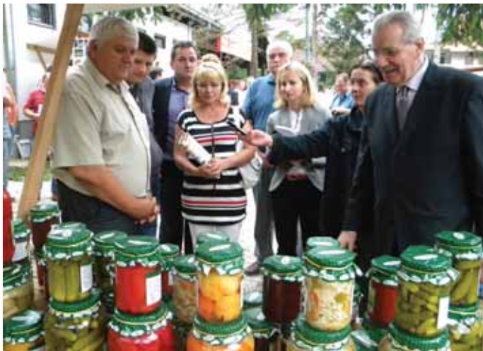
Štand Zadruga „Balatunka“ iz Bijeljine